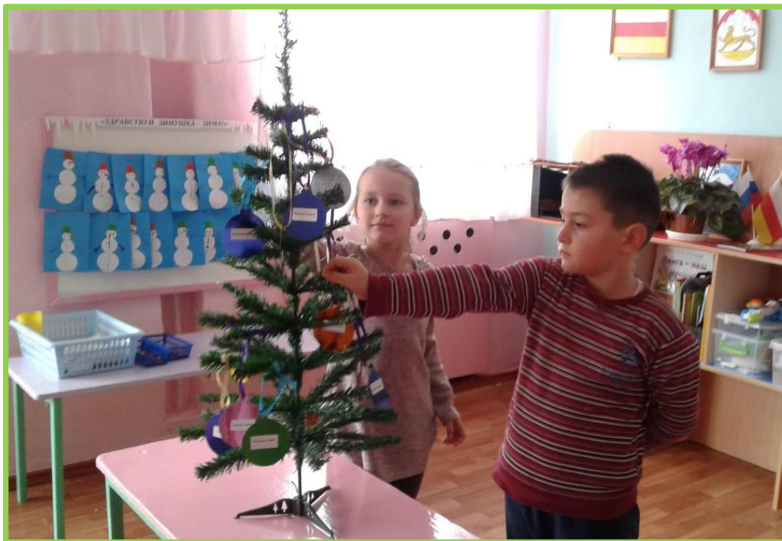
3 шаг. «Елочку желаний» помещаем на видное для родителей место в раздевалке.