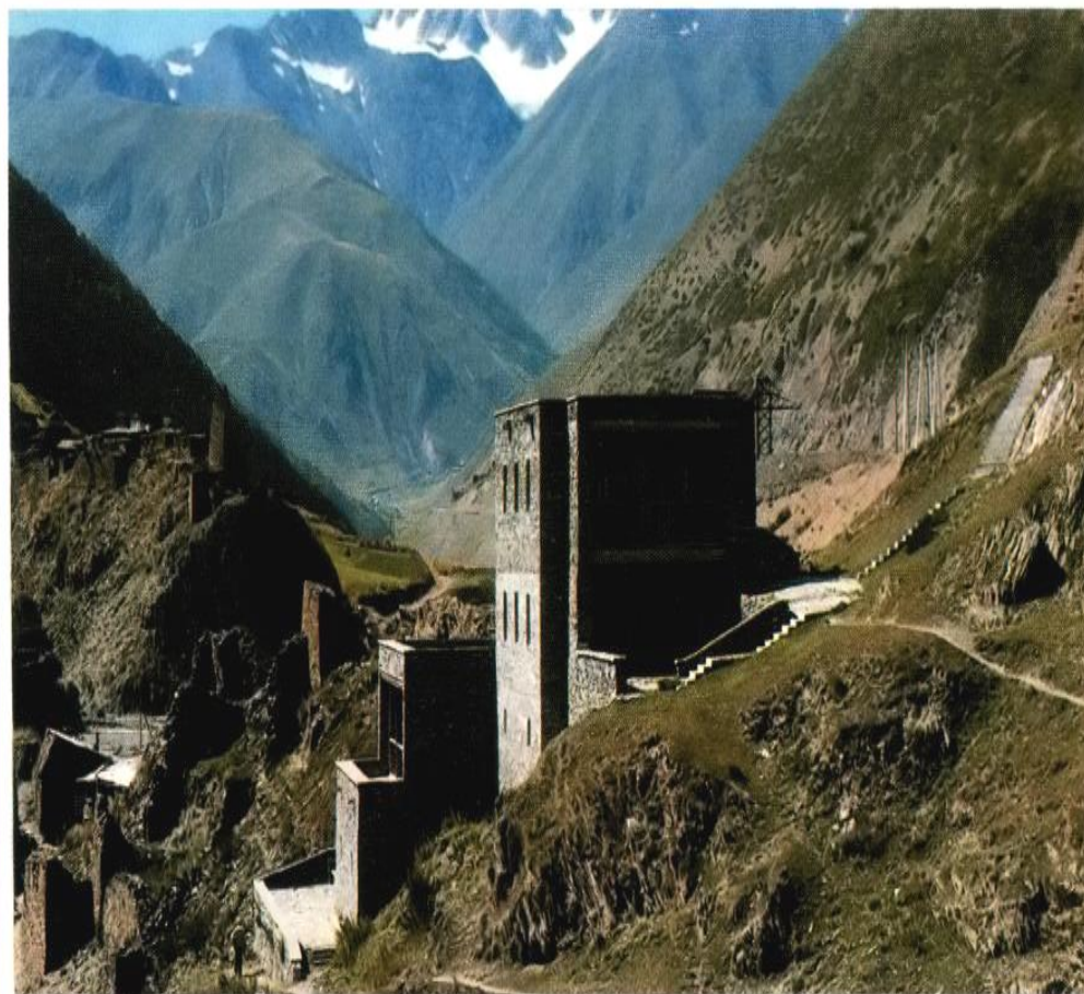
Аул Нар. Музей Коста Хетагурова