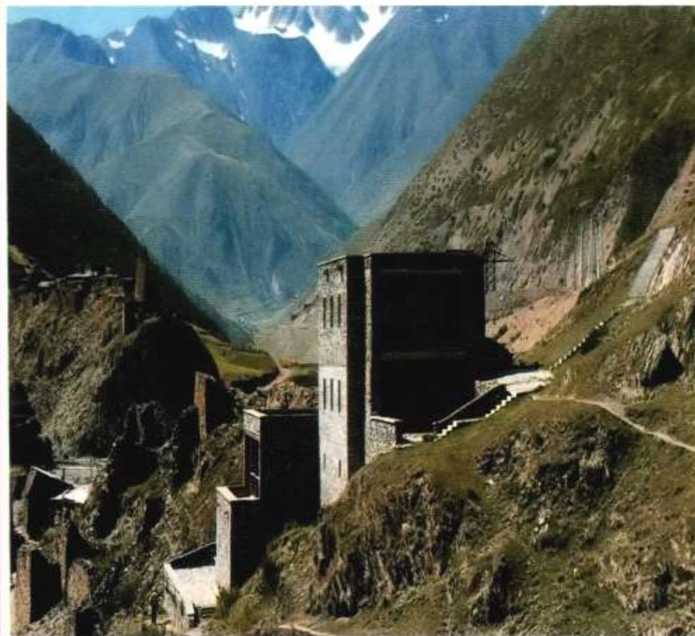
Аул Нар. Музей Коста Хетагурова