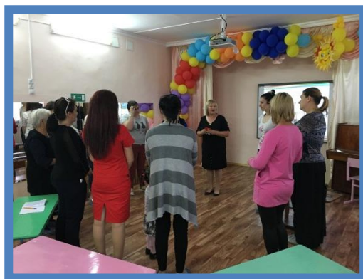
Игра «Добрые пожелания»