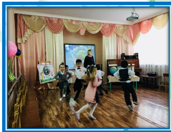
Танец « Вальс »